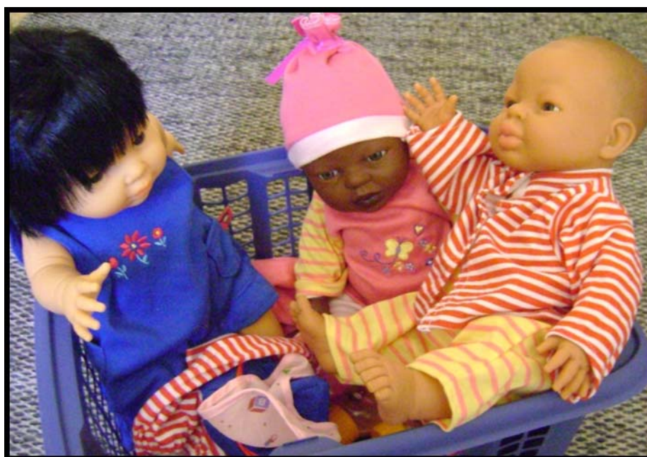
Figur 14. Barnen i ålder 1-2 år tyckte om att leka med de stora dockorna.

De små barnen fick inte, som de andra, tillgång till alla leksakerna i leksaksskåpet. Vi två lekpedagoger valde ut leksaker lämpliga för deras ålder och presenterade dem i långsam takt. Den minsta av de röda bollarna, ballongerna, dockorna och köksredskapen var populära.