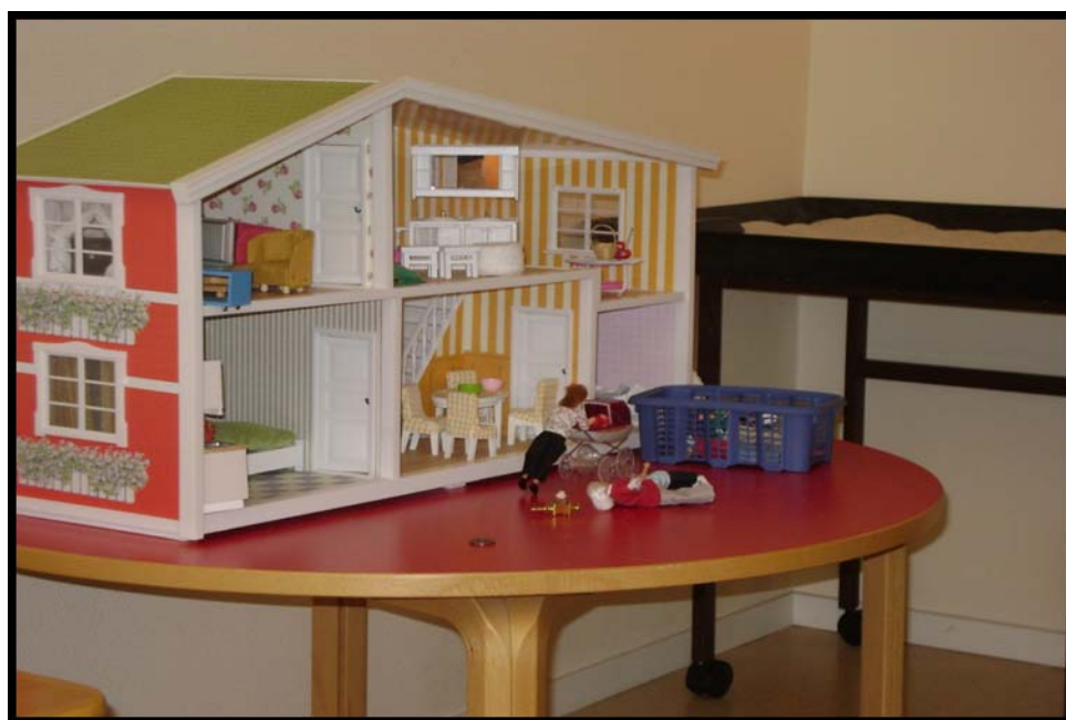
Figur 9. Bilden visar ett välmöblerat hus och en storasyster, som är ute på promenad med sin lillasyster.