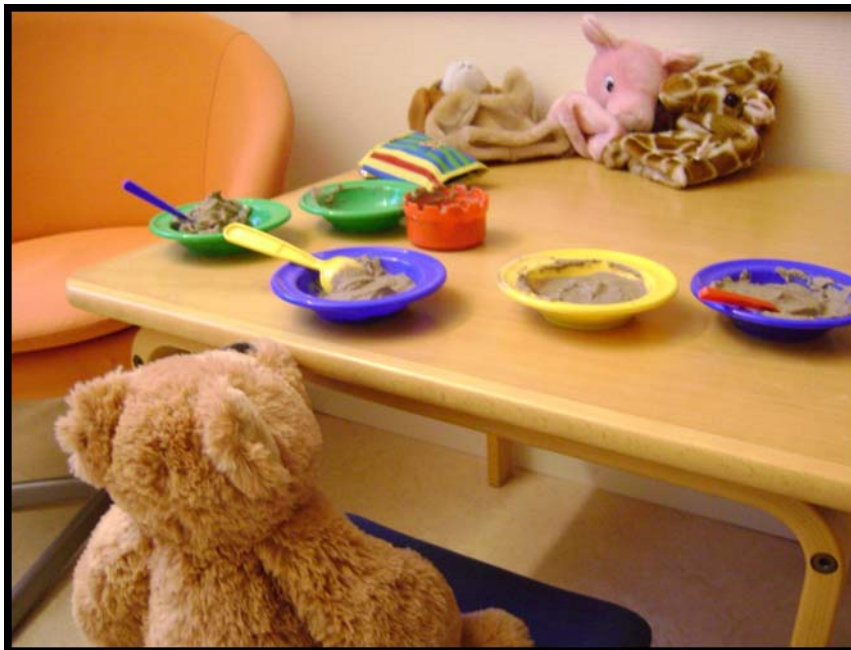
Figur 13. Pojke (1 år 2 månader) Har lagat mat och bjuder nalle och mamma på middag.

Som nämnts under Inledning bodde under projektiden även ett antal yngre barn (1-2 år) med sina mammor på KCK. Det fanns hos de två lekpedagogerna ingen tidigare erfarenhet av lekarbete med så små barn. Men det var tydligt att även dessa barn behövde lekstimulans och glädje. Efter att lekpedagogerna diskuterat med varandra och konsulterat en barnpsykoterapeut infördes småbarnslek på KCK.