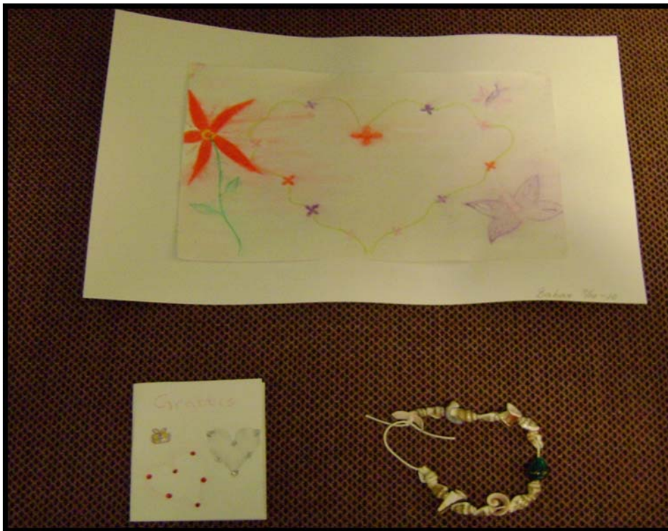
Figur 12. En flicka skapade bilderna och halsbandet.

De flickor som var i ålder 11 till 15 år använde lekarbetstiden till att måla och tillverka föremål som t.ex. smycken. Vi förmodar att de verbalt hanterar sin situation i samtal med sin samordnare på boendet. Medan deras händer målar och organiserar pärlor och snäckor kan de i sitt inre vara på väg mot en viss begriplighet.