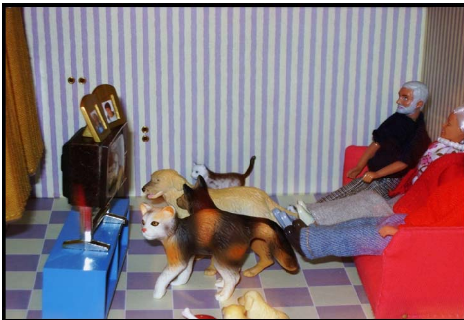
Figur 10. Bilden visar en lugn och välordnad heminteriör. Här sitter mormor och morfar. Pappan skymtar närmast åskådaren. Hundar och katter står prydligt uppställda och tittar på TV med de vuxna. På TV'n syns fotografier av barnen.