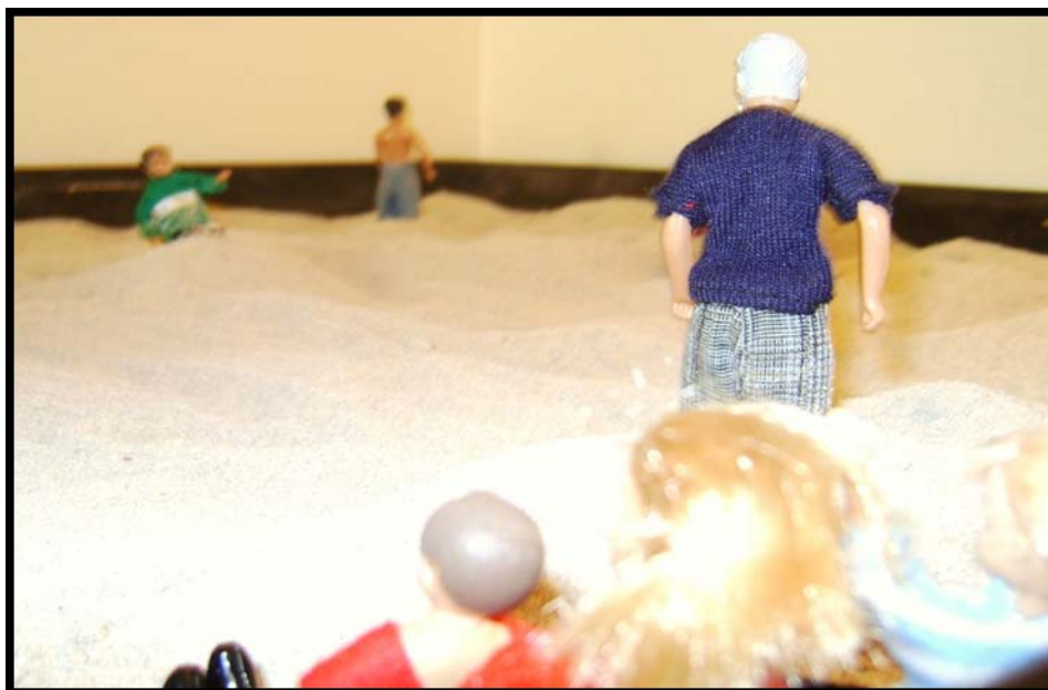
Figur 6. Här ser barnet ryggen på pappa som är på väg bort ifrån dem.