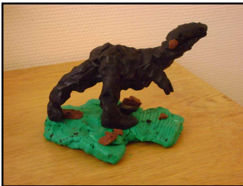
Figur 11. Här syns en mäktig dinosaur.