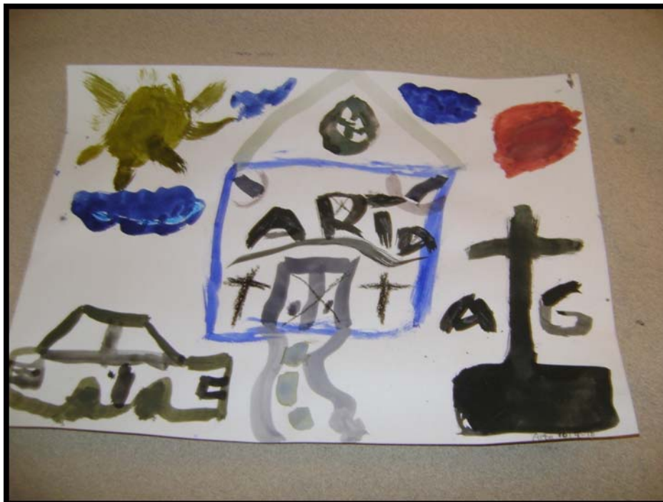
Figur 4. Figuren visar den målning A gjort.

Till slut får han ihop en slarvig rektangel. (Jag bekräftar bara med ”du målar blått”). Sen blandar han färger till något som liknar en röd boll uppe i högra hörnet. Jag säger det. Ja, svarar han då. Sen målar han en svart grav med ett svart kors på höger sida om den blå rektangeln. Eftersom han kan mycket lite svenska så säger jag ”död, någon är död” med frågande röst (jag vet ju att han kan det ordet). Då skriver han AC på graven och säger helt lugnt ”AC är död”. Han är lugn och eftertänksam hela tiden. Han tänker lite, sen målar han blå moln och får av mig, när han frågar, veta vad de kallas, samt ”solen”. Det stör honom inte att den gula färgen är blandad med blått så att solen blir olivgrön. Sedan tar han itu med den blå rektangeln, gör en dörr och tak. Jag bekräftar att han målat ett hus. Han skriver sitt namn på huset. Sen målar han ett kors på var sida dörren. När han gjort det, så målar han ett kryss över dörren och förklarar att man inte kan gå in för där finns något farligt – han pekar på graven för att förklara och sen kommer han på ordet och säger monster. När han sedan målat en bil till vänster om huset så har det gått 20 minuter och han är nöjd.