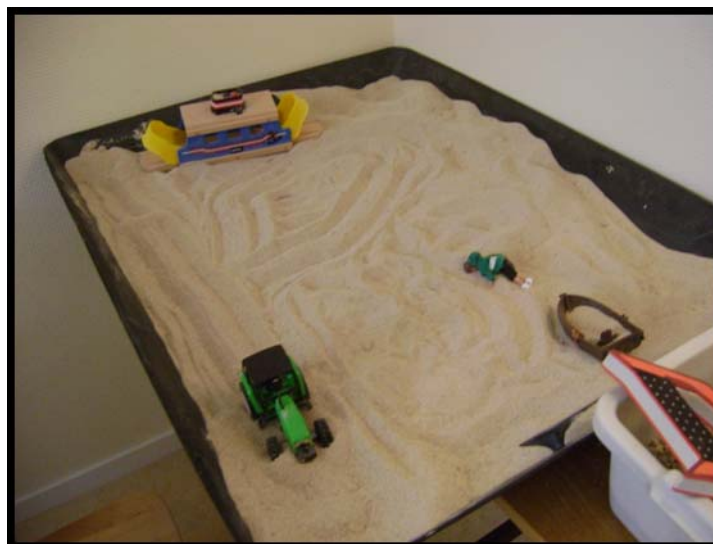
Figur 3. Fotot visar hur T lagt dockpojken T med ansiktet nedåt i sanden.

- Du leker att han är död, kommenterade jag.