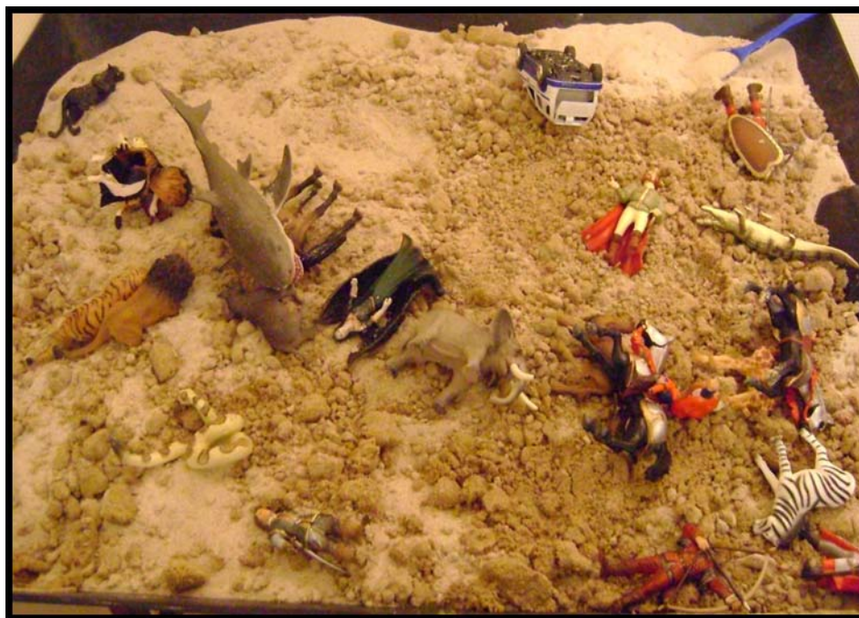
Figur 5. I sandlådan gestaltas Våld, Rädsla – Liv och Död