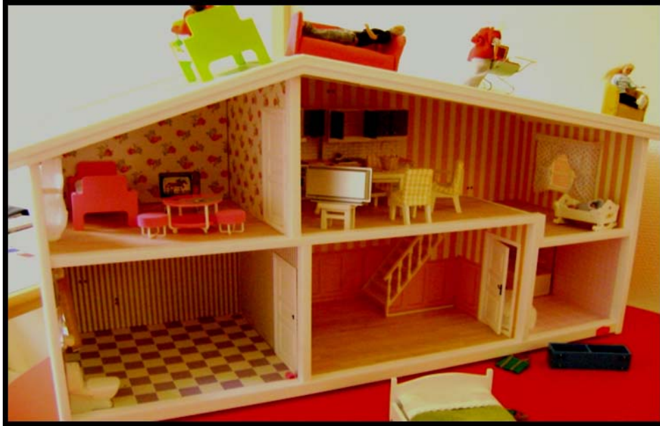
Figur 8. Även här finns kaos och hjälplöshet. Pojken som möblerade detta dockhus kallade familjen som bodde där för den galna familjen

Föräldrarna och barnen vistades på taket och inne i huset fanns endast babyn. Pojken (8 år) skrattade gällt flera gånger under tiden han lekte den projektiva leken. ”Det är inte bra om mammor vinglar för ofta” sa han och demonstrerade mammans vingliga gång med hjälp av mamma-dockan.